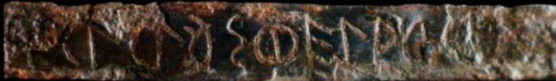
FALCATA DECORADA, CON INSCRIPCIÓN IBERA. MUSEO DE PREHISTORIA DE VALENCIA

Es posible que hace unos 2.500 años se librara un sangriento combate en las inmediaciones de la ciudad ibérica de Ipolca, la actual Porcuna, en Jaén. También es posible que los hechos quedaran idealizados en un impresionante conjunto escultórico cuyos fragmentos, cerca de 1.500, fueron hallados a principios de los años setenta en el Cerrillo Blanco. La reconstrucción y el estudio de estas esculturas han aportado nueva luz al conocimiento del todavía enigmático mundo de los iberos.